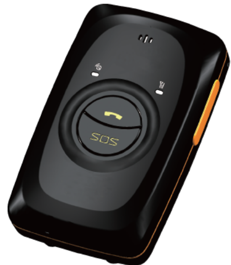
MeiTrack MT90 személykövető